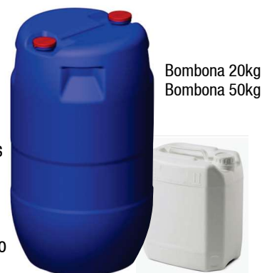
Bombona 20kg Bombona 50kg